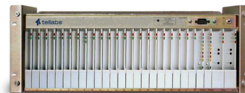
Tellabs 1000 VGW